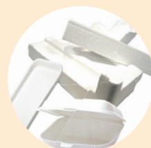
聚苯乙烯泡沫 (例如發泡膠)