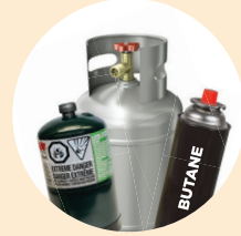
丙烷氣罐和 丁烷氣瓶/罐